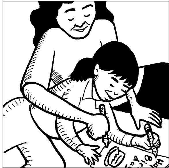
Una tarjeta es una promesa para hacer algo con alguna persona después.

Usted ayudará a su niño a hacer una tarjeta de regalo para una persona especial. Explique que esta tarjeta es una promesa que hará algo con esa persona después. Haga que su niño elija una tía, tío, o abuelo para darle la tarjeta de regalo.