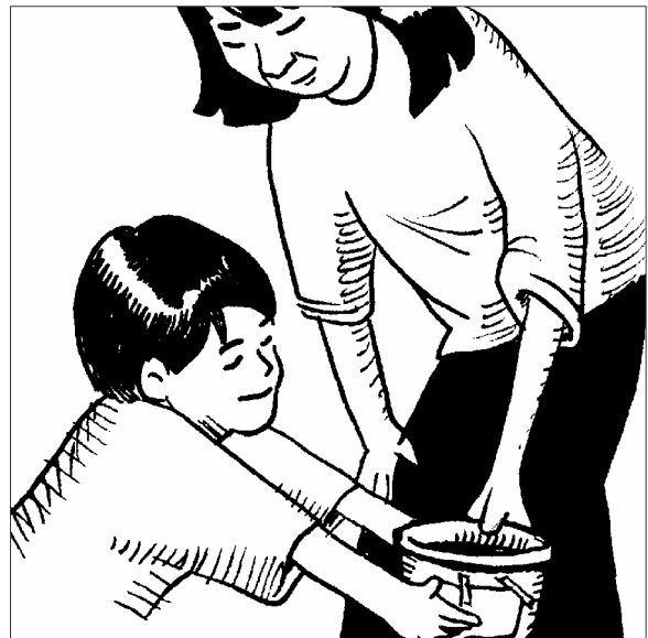
Ayude a decorar el recipiente para dinero con fotos de las cosas que su niño quiere comprar.

Usted ayudará a su niño a hacer un recipiente especial para dinero. Su niño puede usar el recipiente para mantener el dinero seguro hasta que sea hora de ir a la tienda. Deje claro que su niño puede decidir cómo gastar el dinero del recipiente.